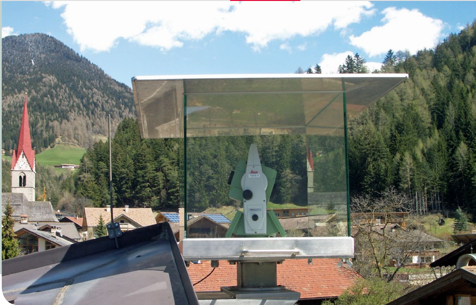
■ Une station totale Leica Viva TS15 en pleine surveillance des mouvements, à Mules.

ment remplies » raconte Lienhart Troyer, exprimant la satisfaction de Trigonos vis-à-vis des résultats.