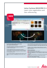
Leica Cyclone REGISTER