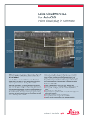
Leica CloudWorx for AutoCAD

Leica Geosystems AG www.leica-geosystems.com