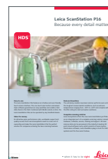
Leica ScanStation P16