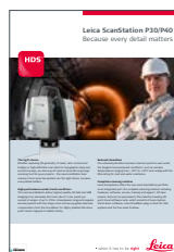
Leica ScanStation P30/P40

Illustrasjoner, beskrivelser og tekniske data er ikke bindende. Alle rettigheter er reservert. Trykket i Sveits – Copyright Leica Geosystems AG, Heerbrugg, Sveits, 2016. 846878no – 04.16