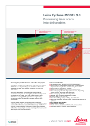
Leica Cyclone MODEL