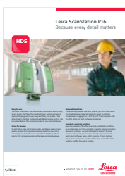
Leica ScanStation P16

Illustrations, descriptions et données techniques non contractuelles. Tous droits réservés. Imprimé en Suisse - Copyright Leica Geosystems AG, Heerbrugg, Suisse, 2016. 832268fr - 03.17