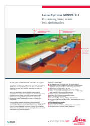
Leica Cyclone MODEL