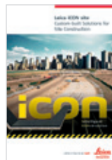
Leica iCON site Brochure