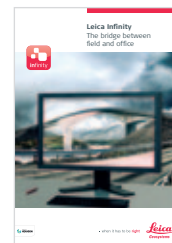
Leica Infinity Software brochure