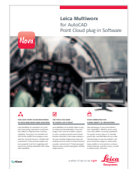
Leica Multiworx Software brochure